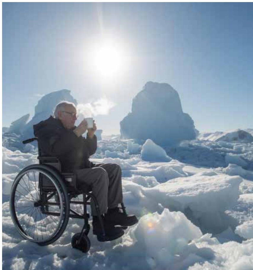
Ilustrační fotografie vytvořená umělou inteligencí

Samozřejmě zde však nenajdeme žádnou civilní infrastrukturu, jako jsou klasická města, obchody nebo zdravotní péče, takže pro zmapování života seniorů musíme po řádcích časopisu Listy z Domova cestovat jinam, konkrétně do 18 000 km vzdáleného Grónska. Mimochodem, jde o jednu z nejdelších možných cest na Zemi, vzhledem k tomu, že se obě místa nacházejí na opačných koncích planety. Let trvající z jedné oblasti do druhé by při průměrné rychlosti dopravního letadla zabral necelých 20 hodin čistého času.